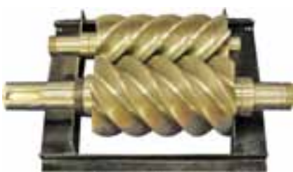
Den Doppelschneckenexpander in der Green Machine entwickelten Forscher an der Universität London.

im Niedertemperaturbereich in ORC-Aggregaten kleiner Baugröße spezialisiert. In ihrer ursprünglich für die Geothermie entwickelten „Green Machine“ kommt ein spezieller Doppelschraubenexpander (Twin Screw Expander) zum Einsatz, für den das Unternehmen eine Lizenz von der Universität London erwarb.