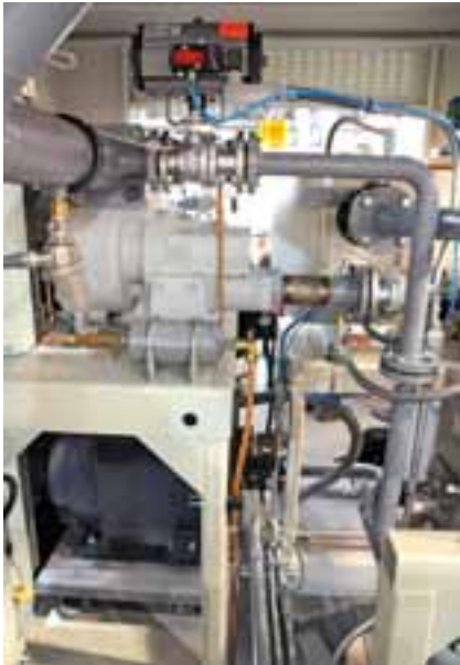
Auf der Fachmesse zur 22. Jahrestagung des Fachverbandes Biogas im Januar 2013 in Leipzig ermöglichte das US-amerikanische Unternehmen ElectraTherm einen Einblick in ihr kompaktes ORC-Modul „Green Machine“.