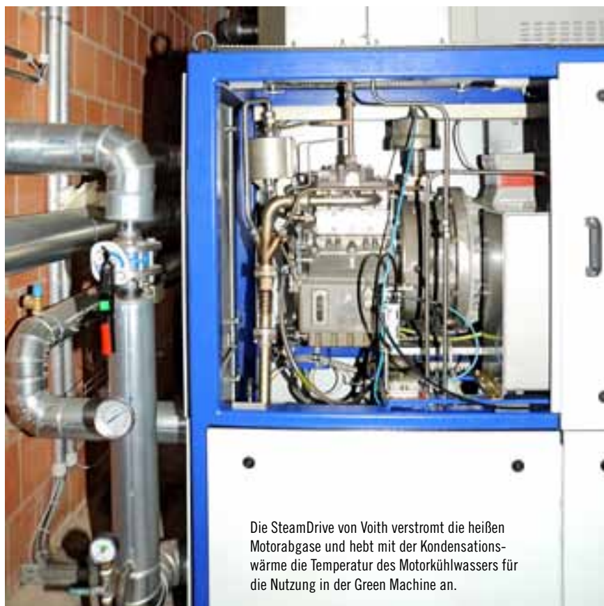
Die SteamDrive von Voith verstromt die heißen Motorabgase und hebt mit der Kondensationswärme die Temperatur des Motorkühlwassers für die Nutzung in der Green Machine an.

Fündig wurden sie beim US-amerikanischen Unternehmen ElectraTherm und beim deutschen Technologiekonzern Voith. Die 2005 gegründete Firma ElectraTherm in Reno (Nevada) ist auf die Nutzung von Abwärme ▶