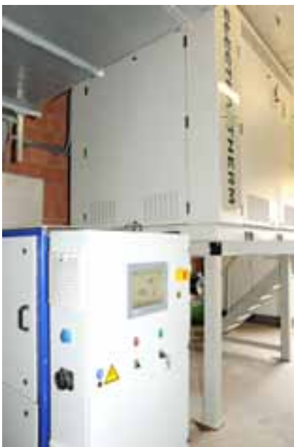
Das Tandemsystem aus SteamDrive und Green Machine nutzt die BHKW-Abwärme im Hoch- und Niedertemperaturbereich optimal für die Verstromung.